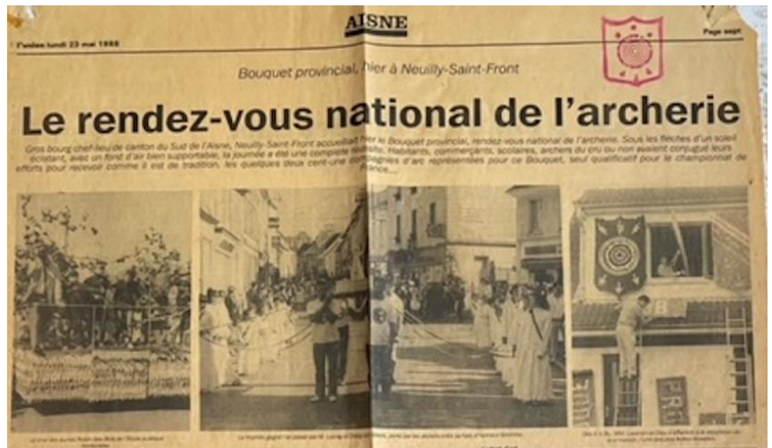
Le Bouquet Provincial du 22 mai 1988 de Neuilly-Saint-Front dans la presse locale

Archers du temps passé, Archers du temps présent, Nous vous saluons !