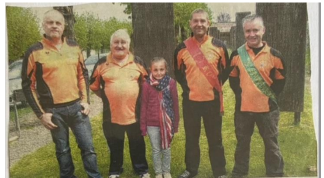
Roy de père en fils dans la famille Dhotel.