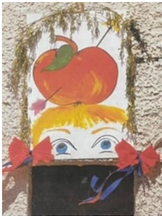
Décorations dans les rues lors du Bouquet Provincial